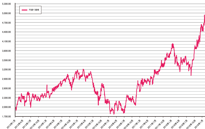
パラジウム地金 グラフチャート 円建て価格(2013年1月～)